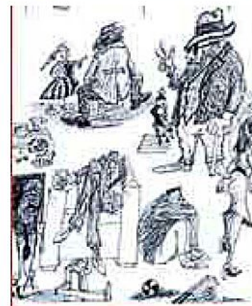
I personaggi A lato, Ettore Scola; sopra, un suo disegno; in alto, Toni Servillo